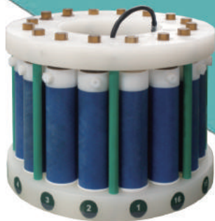
十六位高压组合消解罐架