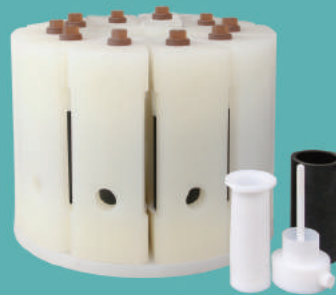
十位独立框架超高压消解罐架