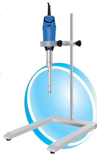
B-170手持式均质分散机