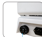
独立限温报警系统