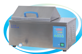
DK系列电热恒温水槽