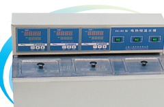
三孔电热恒温水槽