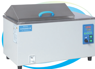
振荡水槽 DKZ-1/DKZ-2 DKZ-3/DKZ-2B