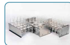
多规格试管、试管架