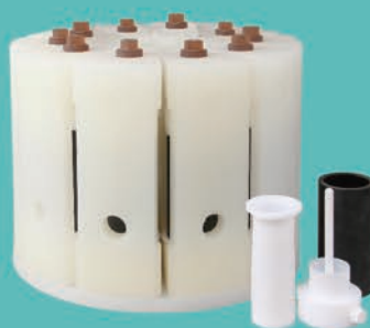
十位独立框架超高压消解罐架