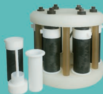
六位高压组合消解罐架