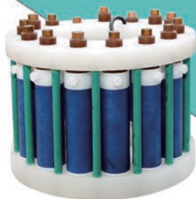
十五位高压组合消解罐架